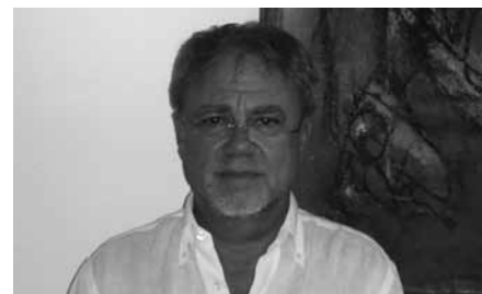
Sociedade Brasileira de Psicanálise de São Paulo (SBPSP)

Nosek: Eu que agradeço a gentileza de vocês e a oportunidade de dialogar com nossa comunidade. Reitero que informações mais detalhadas podem ser obtidas no site da Fepal e do congresso: www.fepal2012.com