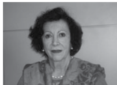
Sociedade Brasileira de Psicanálise de São Paulo (SBPSP)

A nova equipe editorial espera que vocês, leitores, possam usufruir da leitura deste jornal.