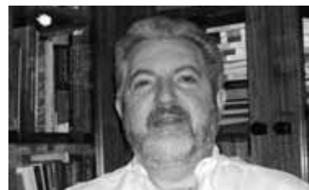
Sociedade Brasileira de Psicanálise de São Paulo (SBPSP)

Acreditamos que os leitores brasileiros sentir-se-ão mobilizados e identificados com as inquietantes questões tratadas neste número. Desejamos a todos uma boa leitura.