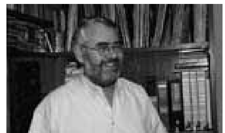
Sociedade Psicanalítica de Porto Alegre (SPPA)

Existiria alguma forma de caracterizar como se sente um analista em seu trabalho? Em suas oscilações entre tradição e invenção? Em seus sucessivos estados mentais? Entre seus momentos de compreensão e não-compreensão, como diria Betty Joseph? Entre sentir-se construído ou em construção? Entre tantas possibilidades, à medida que escrevia este texto, e participava do luto nacional por Millôr Fernandes, me lembrei de um momento longínquo em que, na voz de Paulo Autran, ouvi estas palavras de Louis Javet e Jean Louis Barrault, coletadas por Millôr e Flávio Rangel para a peça Liberdade liberdade, e que talvez captem com mais argúcia do que as descrições analíticas, em que consiste a identificação com um ofício: “Sou apenas um homem de teatro. Sempre fui e sempre serei um homem de teatro. Quem é capaz de dedicar toda a vida à humanidade e à paixão existentes nestes metros de tablado, este é um homem de teatro”.