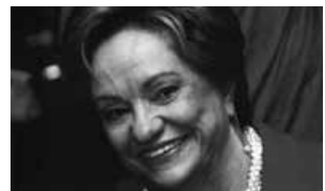
Sociedade Brasileira de Psicanálise de São Paulo (SBPSP).