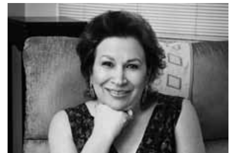
Sociedade Psicanalítica de Mato Grosso do Sul (SPMS)

Portanto, muito trabalho pela frente. Abraços calorosos e até nosso próximo número.